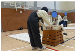
◀(上から)跳び箱、工作、理科実験