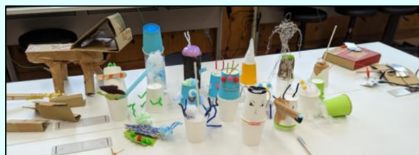
子どもたちの作品がある場所 (みんなのモンスター)