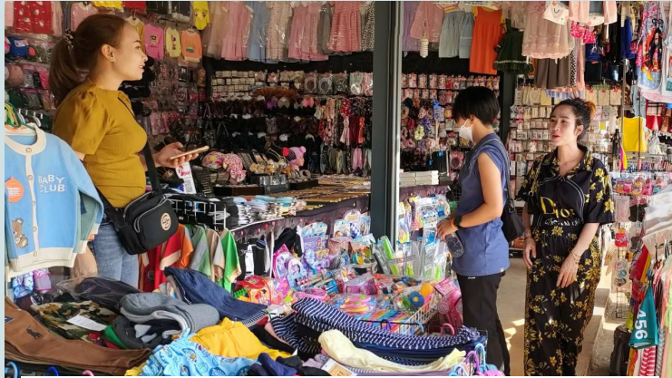
市場調査、材料収集、製作